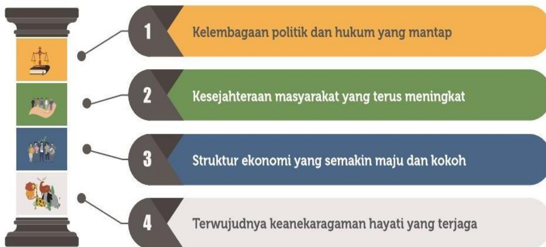
Gambar. Empat Pilar RPJMN IV tahun 2020 - 2024

Rencana Pembangunan Jangka Menengah Nasional (RPJMN) 2020-2024 merupakan tahapan terakhir dari Rencana Pembangunan Jangka Panjang Nasional (RPJPN) 2005-2025. Terdapat 4 (empat) pilar dari RPJMN 2020-2024 untuk mencapai tujuan utama dari rencana pembangunan nasional periode terakhir, yaitu: